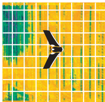
Méthode par télédéttection