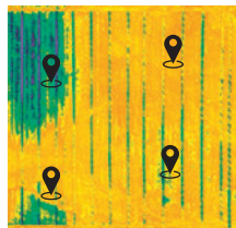
Méthode par échantillons

La télédéttection permet d'observer la biomasse du colza et le taux de chlorophylle du blé, pour chaque mètre carré sans prélèvements destructifs.